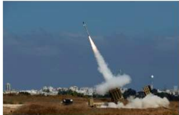
Protiraketový štít má podle ruského generála ohrožovat Rusko a Čínu (ilustrační foto)

Vedení Severoatlantické aliance i Bílý dům na svou obranu zdůrazňují, že má systém sloužit obraně evropských států proti hrozbám z Blízkého východu nebo Severní Koreje, nikoliv proti Rusku.